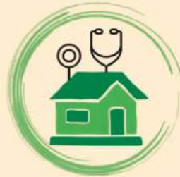
SAMFYC SOCIEDAD ARAGONESA DE MEDICINA DE FAMILIA Y COMUNITARIA